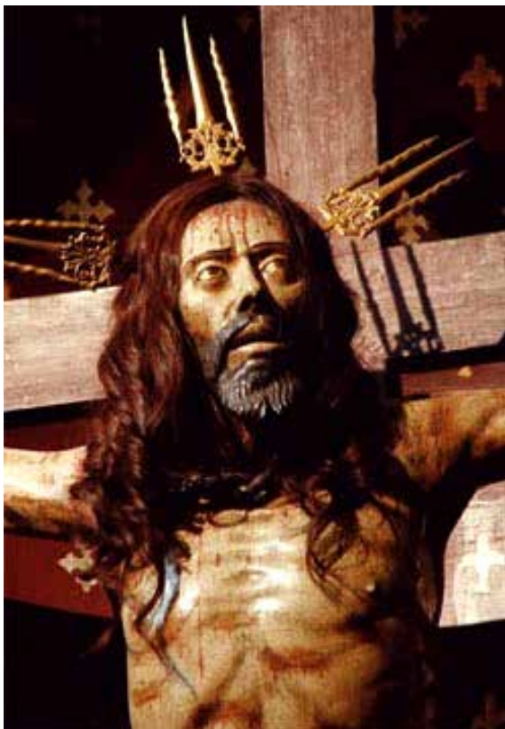
Escultura del Cristo de Mayo en la Iglesia de San Agustín en Santiago de Chile